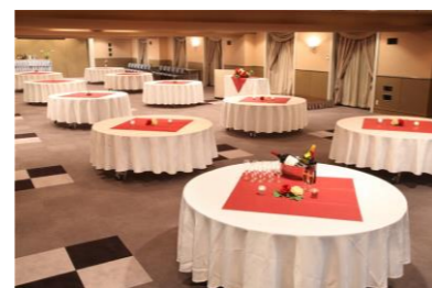
8階 キングススクエア(パーティ時)